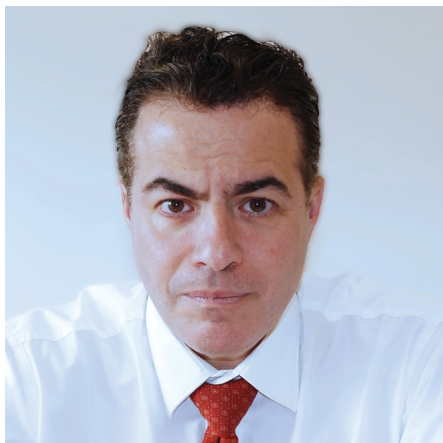
1º Livre Docente em Direito Notarial e Registral do Brasil, pela Universidade de São Paulo; Doutor em Direito Civil e Graduado em Direito pela USP; Coautor da Coleção Tratado Notarial e Registral, entre outras obras; Juiz substituto em 2º grau na 4ª Câmara de Direito Privado do Tribunal de Justiça de SP.

“O ano de 2025 marcou um período de importantes transformações para a atividade notarial e registral, com avanços normativos que reforçaram a segurança jurídica”