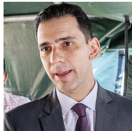
O juiz auxiliar da Corregedoria Nacional de Justiça, Rodrigo Gonçalves, reitera que a Semana representa um esforço concreto no combate à invisibilidade civil

Rodrigo Gonçalves de Souza, juiz auxiliar da Corregedoria Nacional de Justiça