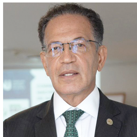
O corregedor-nacional de Justiça, ministro Mauro Campbell, ressaltou a articulação entre instituições para o enfrentamento do sub-registro no país

ministro Mauro Campbell, corregedor-nacional de Justiça