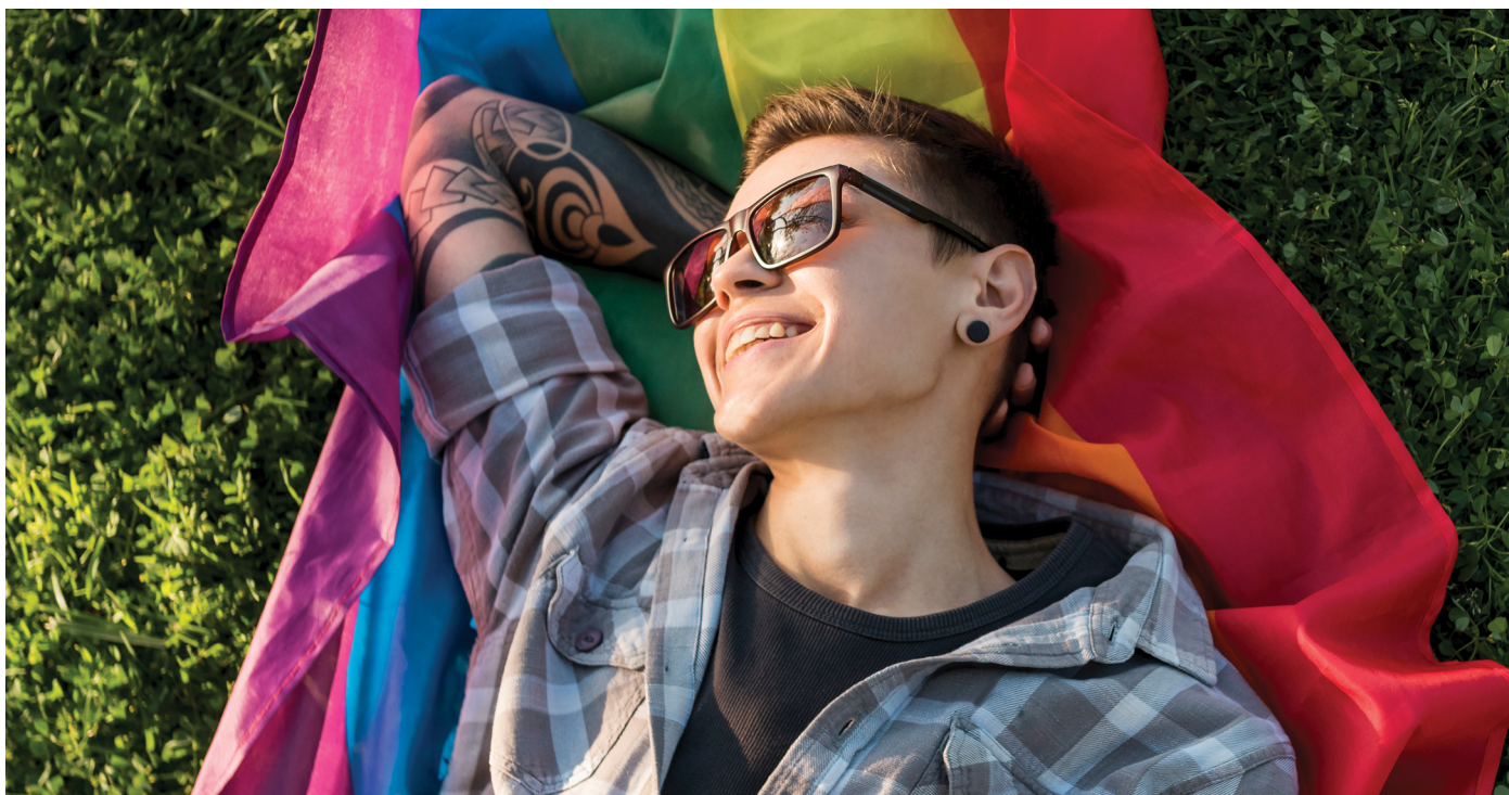
A retificação de nome e gênero diretamente em Cartório garante acesso mais simples, seguro e desburocratizado ao direito à identidade em São Paulo

Com base na decisão do STF e na regulamentação do CNJ, Cartórios de São Paulo registram crescimento contínuo nas retificações de nome e gênero, reafirmando o compromisso com dignidade, cidadania e inclusão social