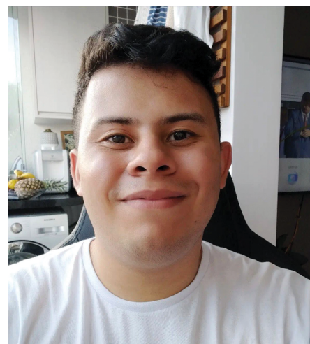
Segundo o historiador Thiago Hespanhol, a trajetória de Adoniran reflete a experiência de muitos paulistanos ao longo do século passado

sa, no Centro Cultural São Paulo (próximo à estação Vergueiro), espaço dedicado a apresentações musicais e ao samba.